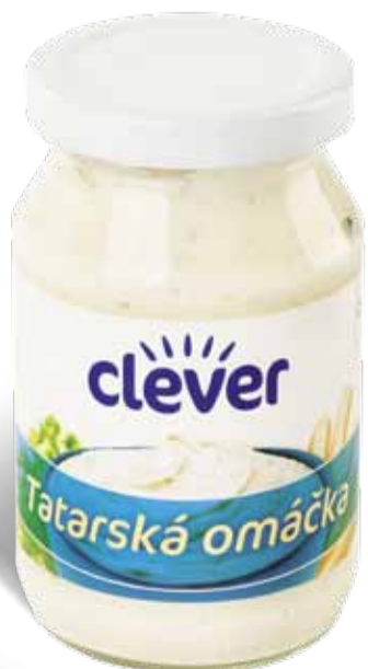
Clever Tatarská omáčka original, s feferony 250 ml, 2 druhy