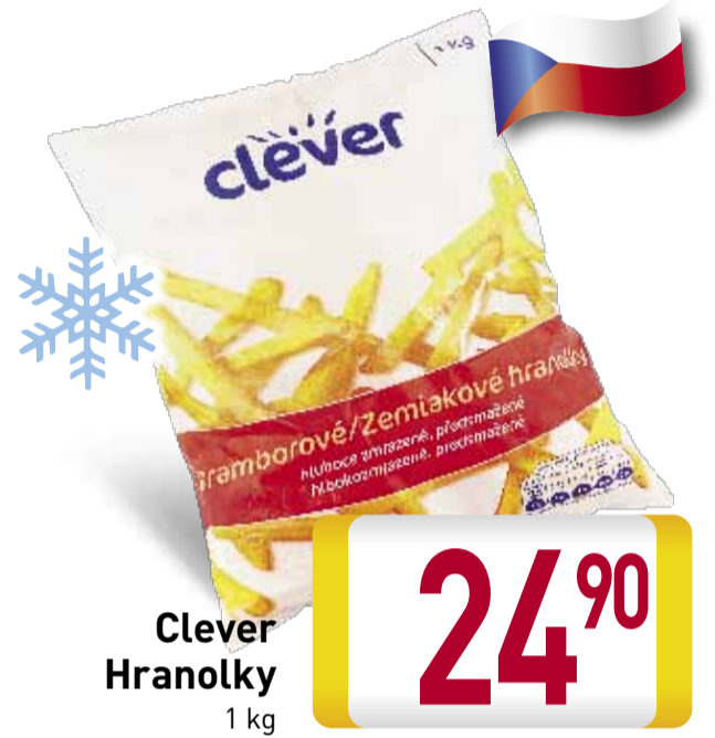
Clever Hranolky 1 kg