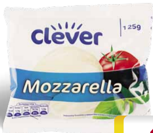
Clever Mozzarella 125 g