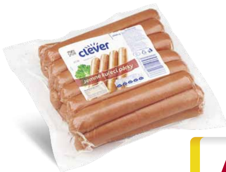
Clever Jemné kuřecí párky 1000 g