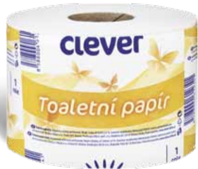
Clever Toaletní papír 1 role, 2vrstvý, 67 m