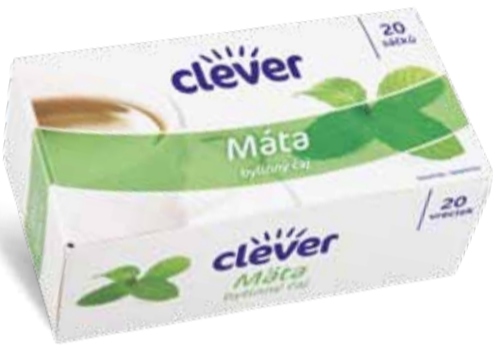
Clever Čaj máta, heřmánek od 30 g, 2 druhy