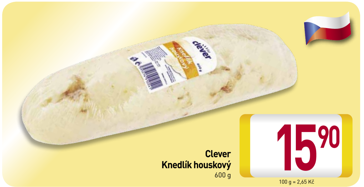
Clever Knedlík houskový 600 g