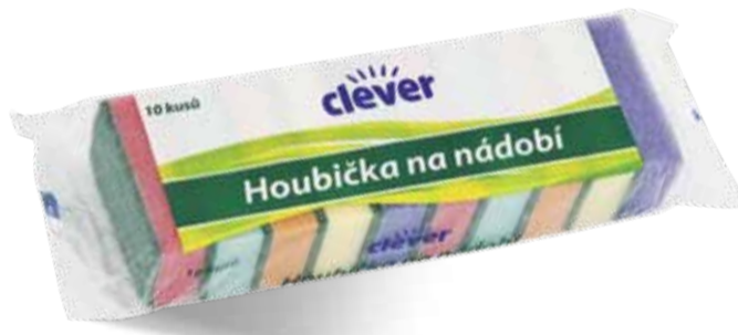
Clever Houbička na nádobí 10 ks v balení