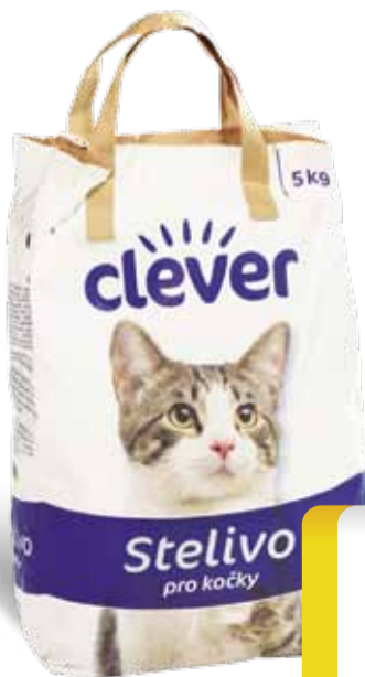
Clever Stelivo pro kočky 5 kg