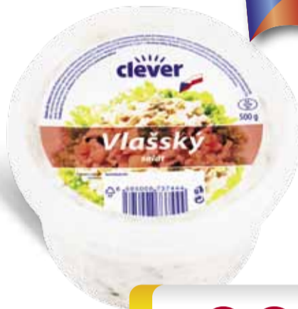
Clever Salát vlašský, bramborový 500 g, 2 druhy