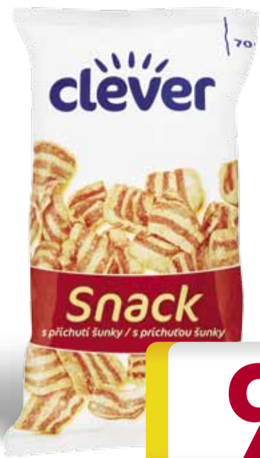
Clever Snack s příchutí šunky 70 g