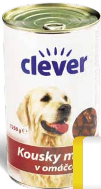
Clever Konzerva pro psy od 1240 g, více druhů