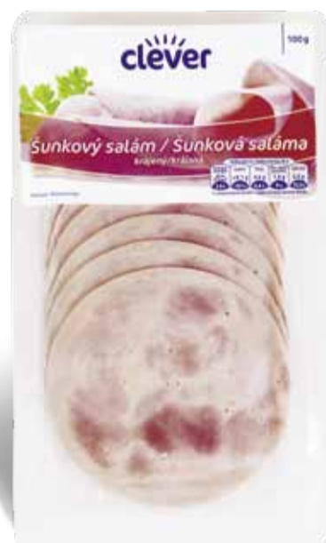
Clever Šunkový salám 100 g