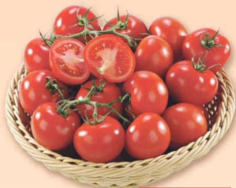
Rajčata keřík dovoz Španělsko, Maroko nebo Turecko I. jakost 1 kg