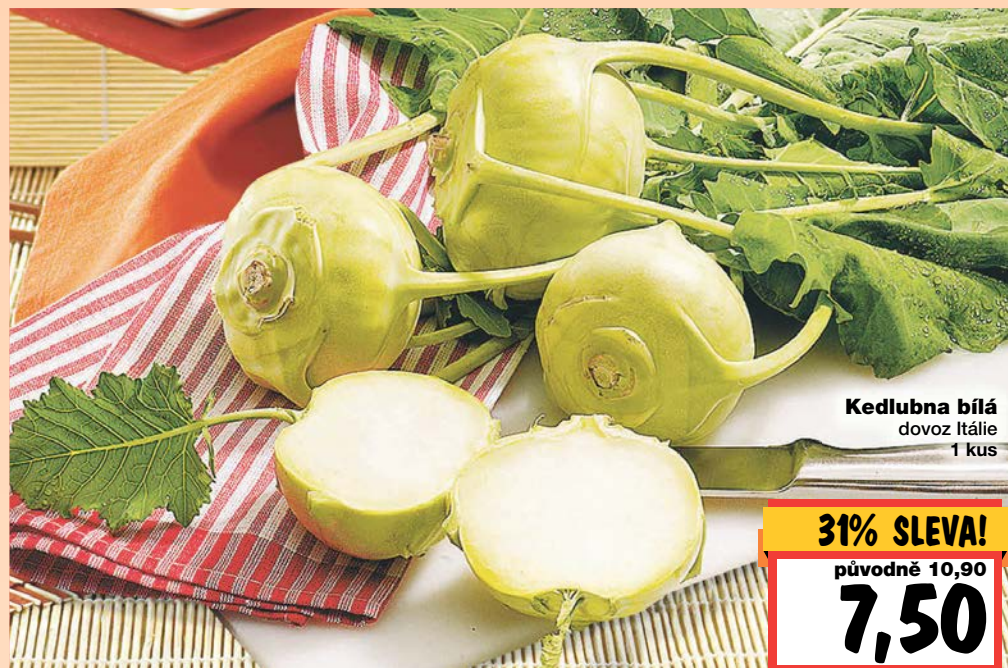
Kedlubna bílá dovoz Itálie 1 kus