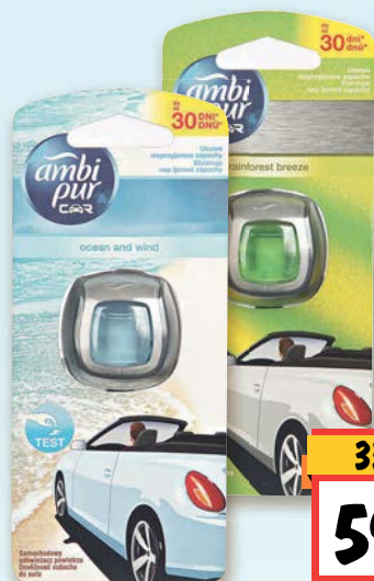
AmbiPur Osvěžovač do auta různé druhy 2 ml