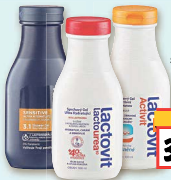
Lactovit Sprchový gel různé druhy 300 ml