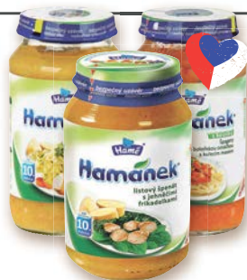
Hamé Hamánek Mazozeleninový příkrm od 7. nebo 10. měsíce 230 g