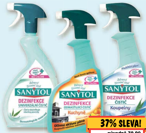
Sanytol Dezinfekční čistič různé druhy 500 ml

37% SLEVA! původně 79,90 49,90 (=1 | 99,80)