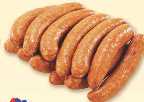
Chodura Maďarská klobása obsah masa 81 % 100 g