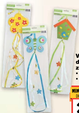
Velikonoční dekorace závěsná ▪ délka: 70 cm ▪ různé druhy