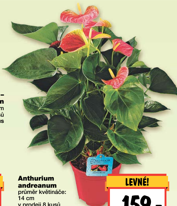
Anthurium andreaeanum průměr květináče: 14 cm v prodeji 8 kusů 1 kus