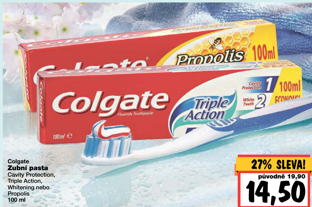
Colgate Zubní pasta Cavity Protection, Triple Action, Whitening nebo Propolis 100 ml