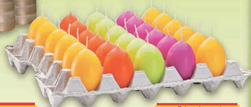
Svíčka ve tvaru vajíčka ▪ různé barvy