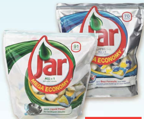
Jar Tablety do myčky žluté nebo Platinum 91 ks nebo 70 ks 1 balení do vyprodání zásob