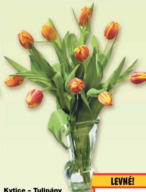
Kytice – Tulipány dvoubarevné v prodeji 13 kusů 1 kus