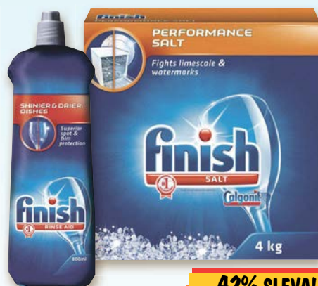
Finish Leštidlo Regular 800 ml nebo Sůl do myčky 4 kg