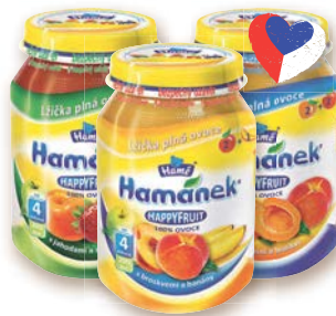
Hamánek Happyfruit Ovocná přesnídávka 100% obsah ovoce různé druhy 190 g