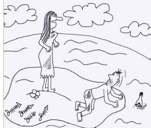
„Už zase rozhazuješ, ta lahev je zálohovaná!“