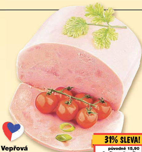
Vepřová šunka pro děti obsah masa 80 % 100 g