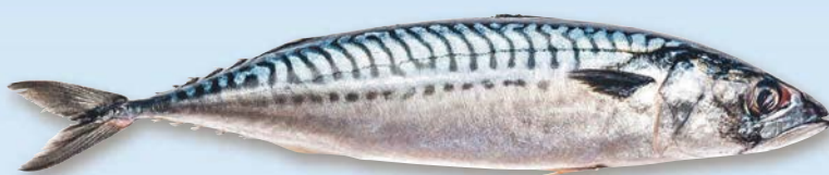
Makrela obecná (Scomber scomber) celá, kuchaňá, chlazená z volné přírody FAO 27 – Severovýchodní Atlantik cca 300 – 400 g 100 g