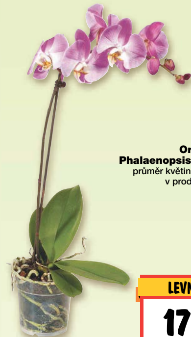
Orchidea – Phalaenopsis 1 výhon průměr květináče: 12 cm v prodeji 20 kusů 1 kus