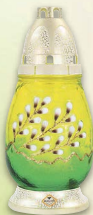
Náhrobní sklo s jarním motivem ▪ náplň: 100 g parafínu ▪ výška: 22,5 cm