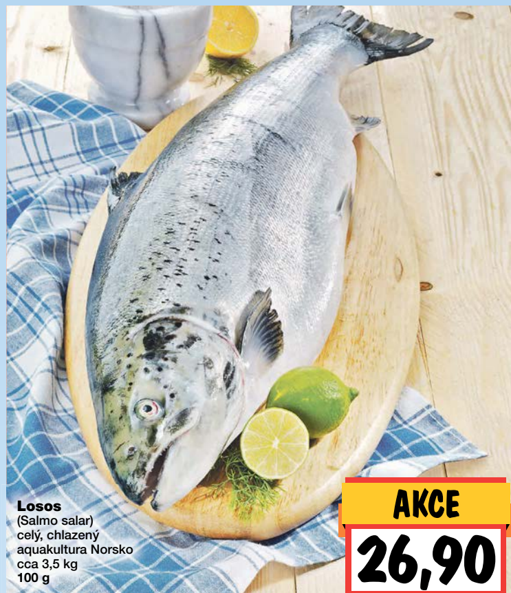
Losos (Salmo salar) celý, chlazený aquakultura Norsko cca 3,5 kg 100 g