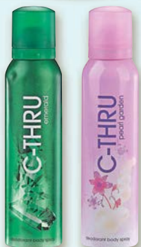
C-THRU Deospray různé druhy 150 ml