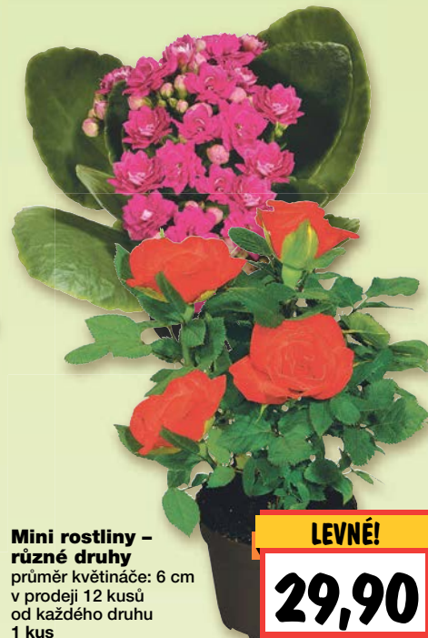
Mini rostliny – různé druhy průměr květináče: 6 cm v prodeji 12 kusů od každého druhu 1 kus