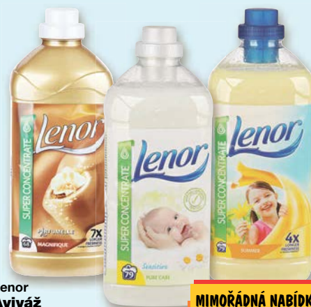
Lenor Aviváž různé druhy 1,7 l = 68 dávek, 1,8 l = 72 dávek nebo 1,975 l = 79 dávek do vyprodání zásob

37% SLEVA! původně 79,90 49,90 (=1 | 99,80)