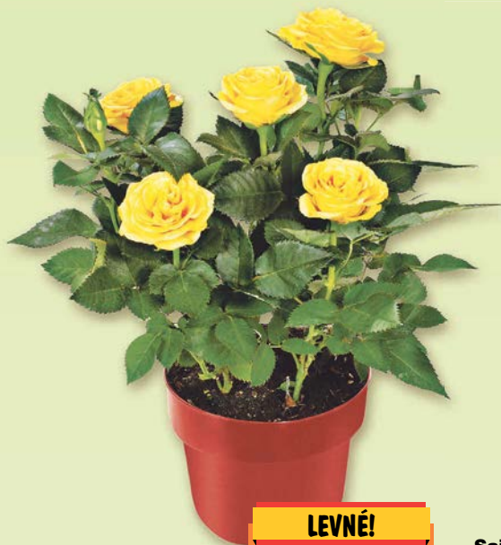
Růže průměr květináče: 10,5 cm v prodeji 24 kusů 1 kus