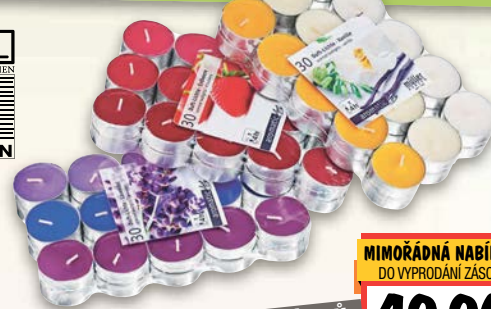
Čajové svíčky ▪ různé vůně