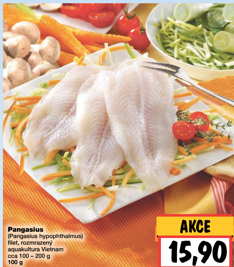
Pangasius (Pangasius hypophthalmus) filet, rozmrazený aquakultura Vietnam cca 100 – 200 g 100 g