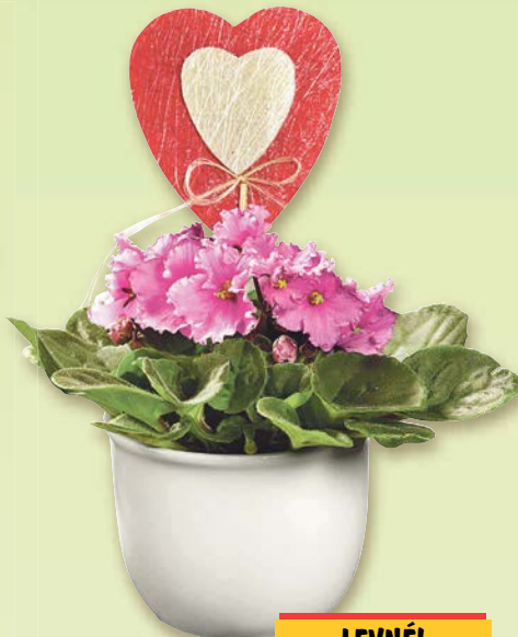
Saintpaulia ionantha s přízdobou průměr květináče: 10 cm v prodeji 10 kusů 1 kus