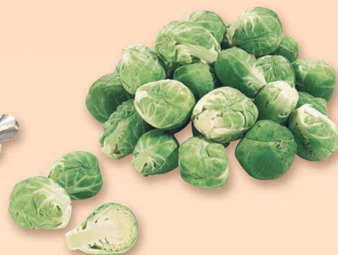
Kapusta růžičková dovoz Nizozemí 500 g balení