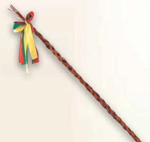
Velikonoční pomlázka proutěná ▪ délka: 90 cm ▪ zdobená třibarevnou stuhou