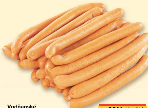
Vodňanské kuře Výběrové pářečky obsah masa 80 % 100 g