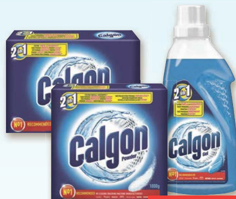
Calgon Odstraňovač vodního kamene prášek, tablety nebo gel 1 kg, 24 kusů nebo 750 ml 1 balení