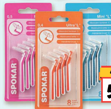
Spokar Mezizubní kartáček Ultra 0,4 mm, Micro 0,5 mm nebo Mini 0,6 mm 8 ks/bal.