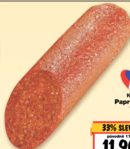
Kmotr Paprikáš 100 g