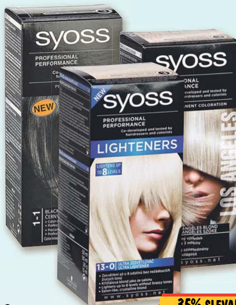
Syoss Barva na vlasy různé druhy 1 kus