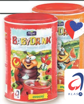
Frape Dětský instantní nápoj ovocný nebo multivitamin od 6. nebo 8. měsíce 400 g