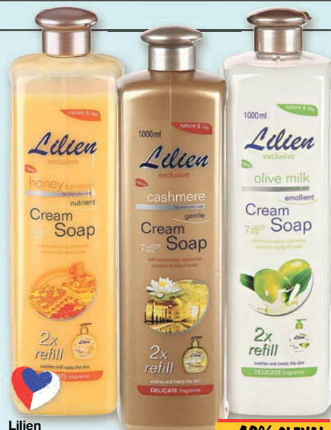
Lilien Tekuté mýdlo Honey, Aloe Vera nebo Minerals náplň 1 l