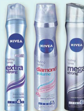
Nivea Lak na vlasy různé druhy 250 ml