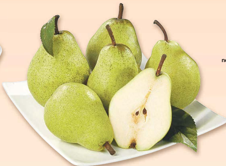
Hrušky zelené Česká republika nebo dovoz Nizozemí nebo Polsko I. jakost 1 kg