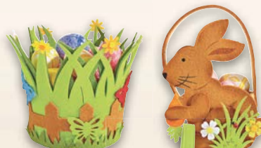
Velikonoční dekorace košík ▪ filcový ▪ rozměry: 17 x 9 x 25 cm ▪ nebo 23 x 16,5 x 11 cm ▪ nebo 14,5 x 17 x 16 cm ▪ různé druhy