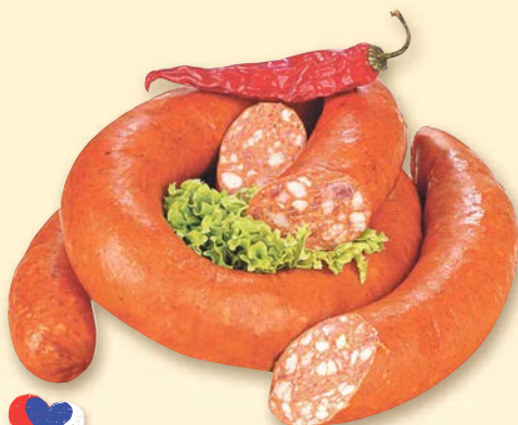
Prantl Polský točený salám 100 g