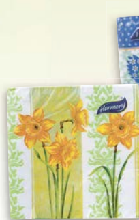
Ubrousky s velikonočním motivem ▪ rozměry: 33 x 33 cm