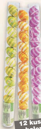
Velikonoční vejce v tubě ▪ průměr: 6 cm ▪ materiál: plast ▪ různé barvy