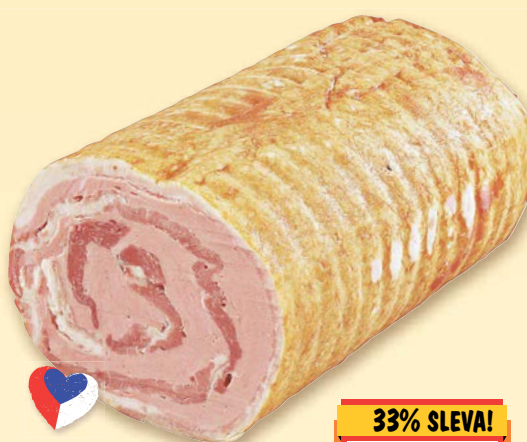
Bivoj Bůčkový závin obsah masa 85 % 100 g