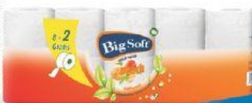
Big Soft toaletní papír broskev 2-vrstvý 8+2 ks