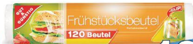
Svačिनové sáčky 18x20 cm 120 ks