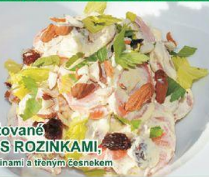
Salát z restované KAROTKY S ROZINKAMI, mandlovými hoblinami a třeným česnekem

1,2 kg karotky, 250 g zakysané smetany, 1 dcl panenského olivového oleje, 60 g živočišného másla, 3 pol. lžice rozinek, 2 pol. lžice mandlových hoblinek, 2 stroužky česneku, snítka velkolisté petržele, 2 pol. lžice cukru moučka, sůl, pepř