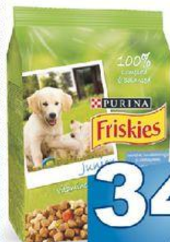
Friskies granule junior balance 500 g