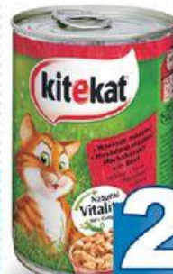
Kitekat hovězí kuřecí rybí 400 g