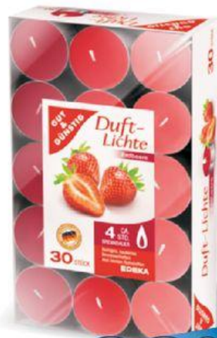
Svíčky vonné: jahoda 30 ks