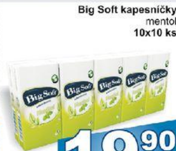
Big Soft kapesníčky mentol 10x10 ks