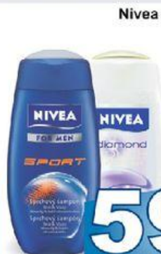
Nivea sprchový gel pro muže sport cool pro ženy diamond 250 ml