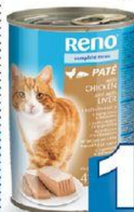
Reno paté s kuřecím a játry kuřecí hovězí 415 g