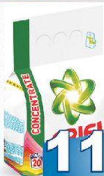
Ariel color 1,5 kg Ariel gel color 1,3 l 20 pracích dávek