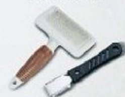
Finišák, trimovací nůž