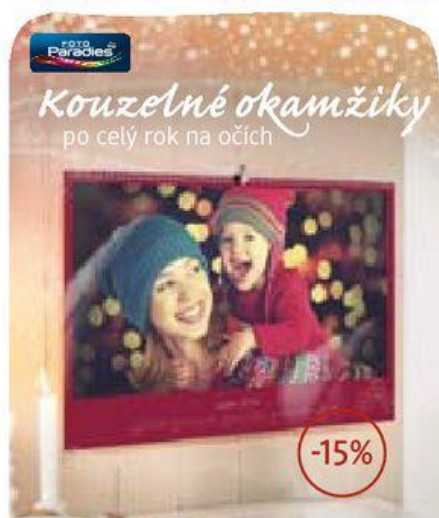
FOTO Paradies Kouzelné okamžiky po celý rok na očích

▼ VŽDY VÝHODNĚ od 22.09.2015 34,90 Kč dříve 39,90 Kč