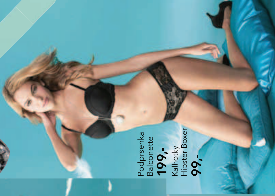
Podprsenka Balconette 199,-