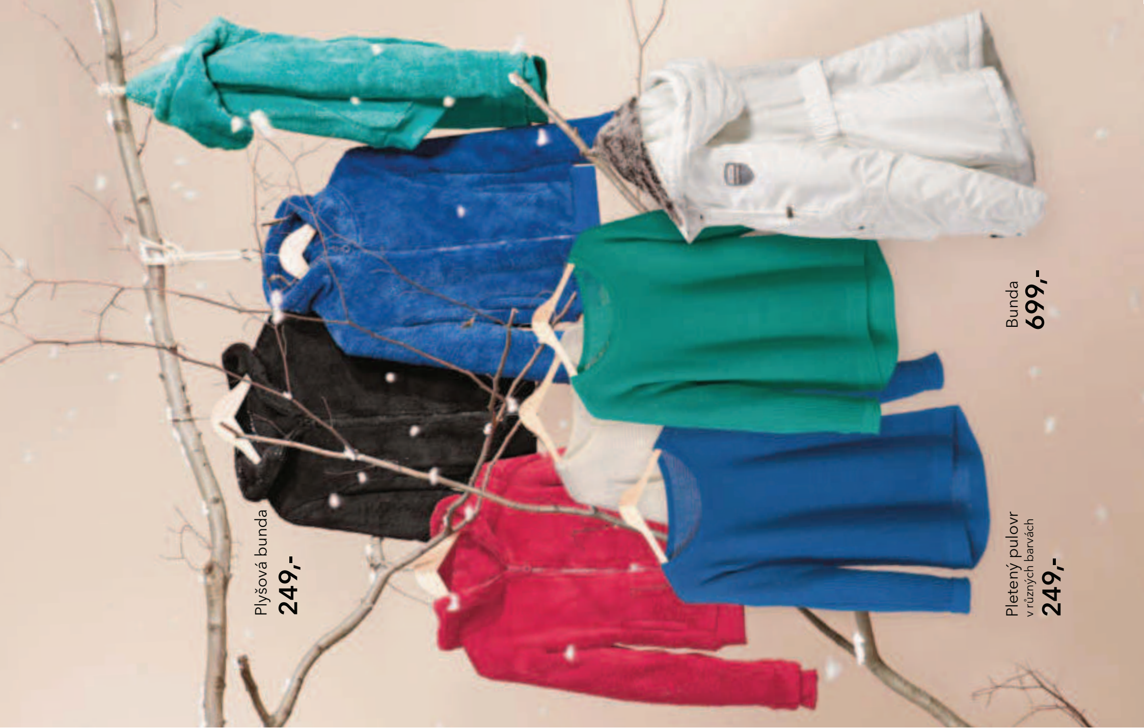
Plyšová bunda 249,-