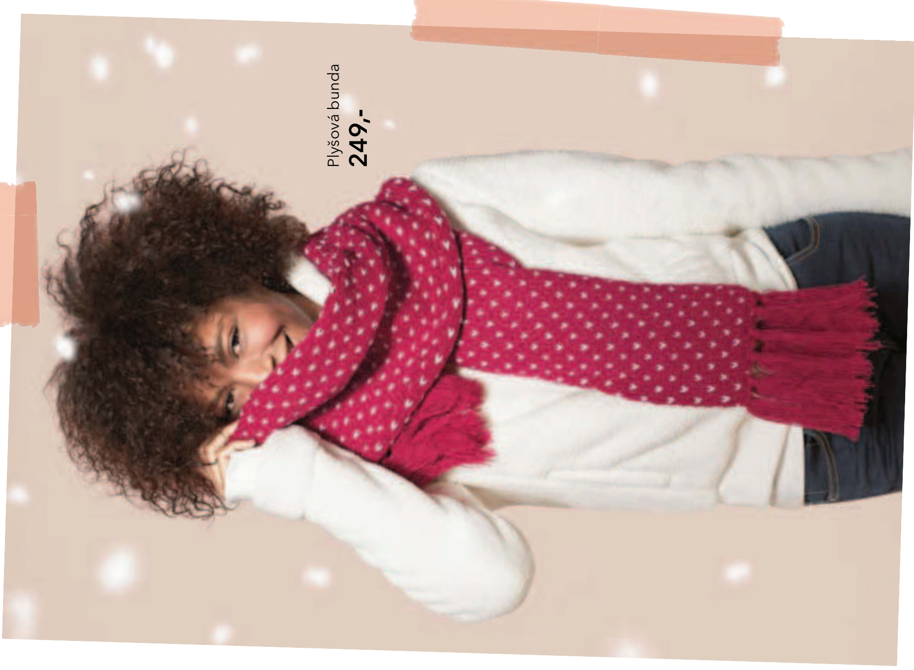
Plyšová bunda 249,-