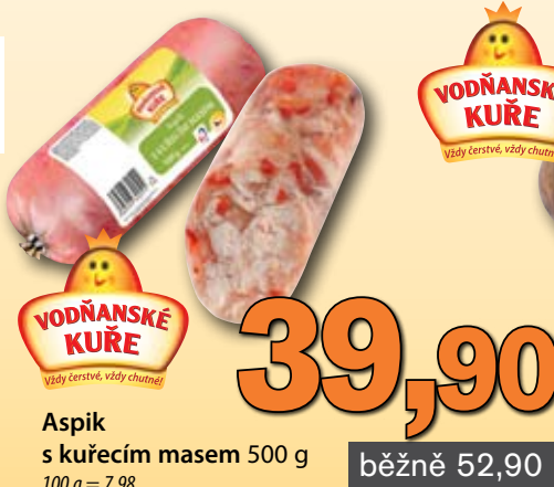
Aspik s kuřecím masem 500 g 100 g = 7,98