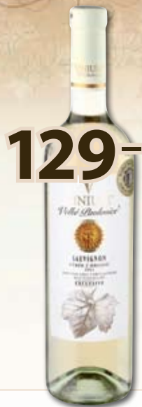
129,- Moravia Exclusive Sauvignon '11 0,75 l

výběr z hroznů; 1 l = 172,- Jiskrně žlutá barva s vůní přezrálého angreštu, ve vůni listy a plody černého rybízu, v chuti připomíná bezový sirup. Doporučujeme podávat ke studeným předkrmům, chřest, kozím sýrům, uzeným rybám. Země původu: ČR, oblast Morava, mikulovská. Teplota k podávání: 8–12 °C.