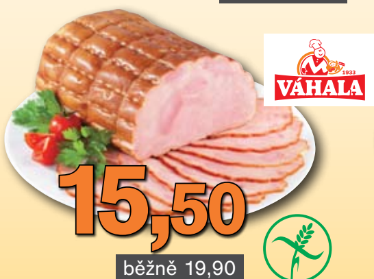
Krůtí prsa speciál 100 g