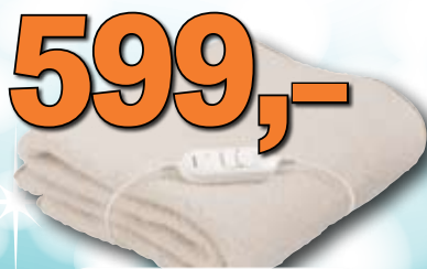
Vyhřívací deka Sencor 150 x 80 cm umělé ovčí rouno; 1 ks = 599,-