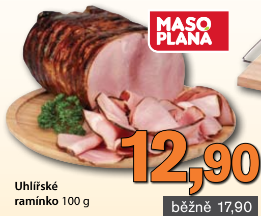
Uhlířské ramínko 100 g