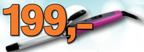
Kulma na vlasy Sencor 1 ks = 199,-