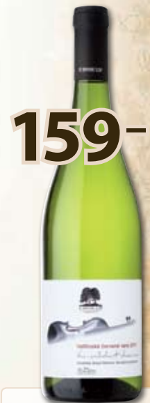
159,- BIO Veltlínské červené '11 0,75 l

pozdní sběr; 1 l = 212,- Víno barvy poledního slunce. Vůně silně kořenitá s projevem extraktivní čajové růže a limety. Chuťový projev je velmi harmonický s pikantní dochutí fíků a lemongrass.