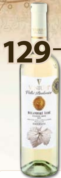
129,- Moravia Exclusive Rulandské šedé '11 0,75 l

výběr z hroznů; 1 l = 172,- Jiskrně žlutá barva s vůní přezrálého angreštu, ve vůni listy a plody černého rybízu, v chuti připomíná bezový sirup. Doporučujeme podávat ke studeným předkrmům, chřest, kozím sýrům, uzeným rybám. Země původu: ČR, oblast Morava, mikulovská. Teplota k podávání: 8–12 °C.