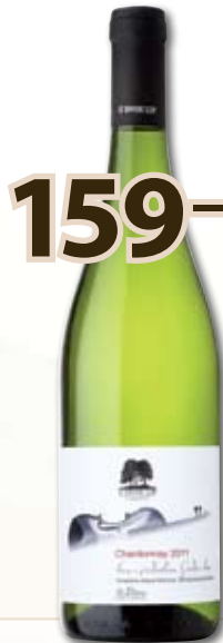
159,- BIO Chardonnay '11 0,75 l

pozdní sběr; 1 l = 212,- Okouzující a vznešená vůně třeshňových květů je doplněna o mandarinkové tóny. Krásná plná a kulatá chut' a příjemná kyselinka, která vás přesvědčí, že mu dala matka Příroda do vínu opravdu jen to nejlepší.