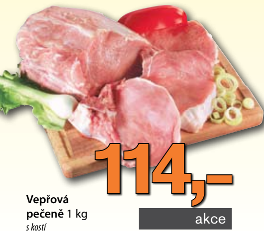
Vepřová pečeně 1 kg s kostí