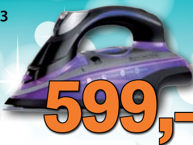
Napařovací žehlička Sencor 1 ks = 599,-