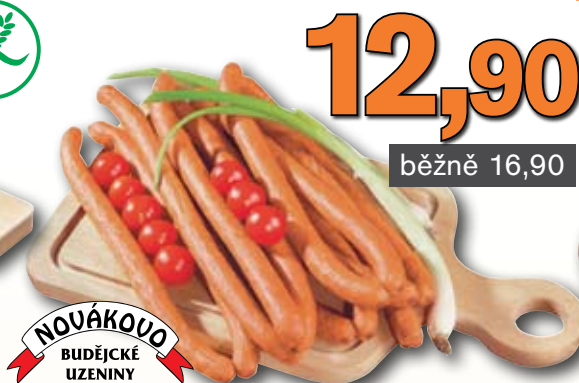
Debrecínské párky se sýrem 100 g