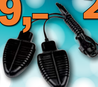
Vysoušeč bot Sencor 1 ks = 299,-