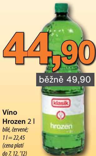
Víno Hrozen 2 l bílé, červené; 1l = 22,45 (cena platí do 7. 12. '12)

Dovolujeme si vás informovat o spuštění nového webu, na kterém najdete přehled bezpečnostních prvků jednotlivého alkoholu.