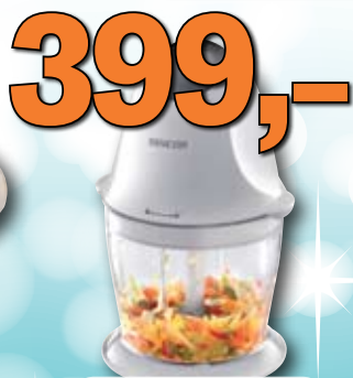
Sekáček potravin Sencor 1 ks = 399,-