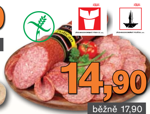
Salám Poličan Dle gusta 100 g