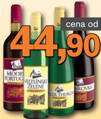
Víno Arie 0,75 l: Veltlínské zelené, Modrý Portugal – 44,90; 1 l: Müller Thurgau, Frankovka – 49,90; 1l = od 49,90 (cena platí do 7. 12. '12)