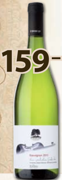
159,- BIO Sauvignon '11 0,75 l

pozdní sběr; 1 l = 212,- Zelenká barva svěžího odstínu vypovídá o vitalitě vámi vybraného vína. Vůně čerstvě posečených kopřiv a letních jablíček je důkazem síly slovácké přírody. Chut' je kulatá a neotřelá. Je v ní cítit větší podíl nasládlých ovocných tónů broskví a borůvek.