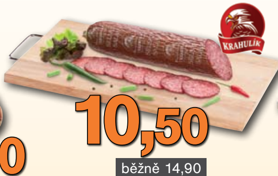
Selský salám 100 g (balení 400 g – 42,-)