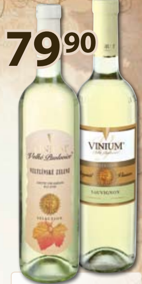
79 90 Vinium Selection 0,75 l

pozdní sběr; 1 l = 172,- Velmi plné, hebké, extraktivní, s jemnými tóny pomeranče, medu, hrušky, karamelu, květin. Doporučujeme ke kachně, drůbeži s nádivkou, uzeným pařeným sýrům, dezertům nebo ovocné bowli. Země původu: ČR, oblast Morava. Teplota podávání: 10–12 °C.