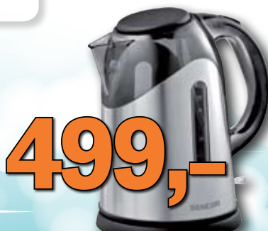
Rychlovarná konvice Sencor 1,7 l nerez/kouřový polykarbonát 1 ks = 499,-