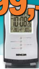
Meteostanice Sencor 1 ks = 299,-