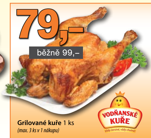
Grilované kuře 1 ks (max. 3 ks v 1 nákupu)