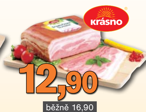
Staročeská slanina 100 g