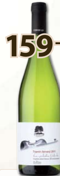
159,- BIO Tramín červený '11 0,75 l

pozdní sběr; 1 l = 212,- Svěží víno zlatavé barvy. V aromatu vás unese svěží exotická vůně sušeného ananasu, jenž v pozadí doplňuje aroma citrusových plodů. Lehký ovocný tón na pozadí zbytkového cukru dává vínu eleganci a kulatost.