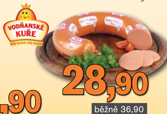
Kuřecí podkova 500 g 100 g = 5,78