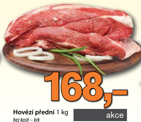
Hovězí přední 1 kg bez kostí – krk