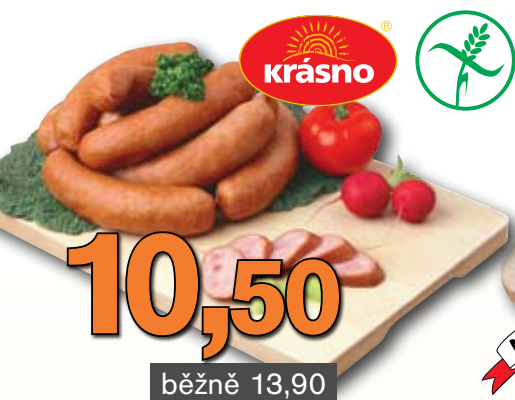
Šunková klobása 100 g