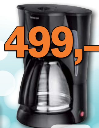
Kávovar Sencor 1 ks = 499,-