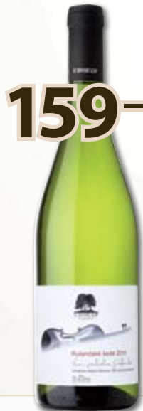
159,- BIO Rulandské '11 šedé 0,75 l

pozdní sběr; 1 l = 212,- Zelenká barva svěžího odstínu vypovídá o vitalitě vámi vybraného vína. Vůně čerstvě posečených kopřiv a letních jablíček je důkazem síly slovácké přírody. Chut' je kulatá a neotřelá. Je v ní cítit větší podíl nasládlých ovocných tónů broskví a borůvek.