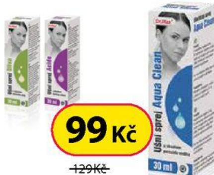
Dr. Max Ušní sprej AQUA CLEAN 30 ml