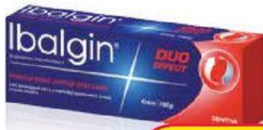
Ibalgin® Duo Effect 100g