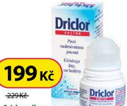
Driclor roll on 20 ml

Lék k vnějšímu užití. Pečlivě čtěte příbalovou informaci.