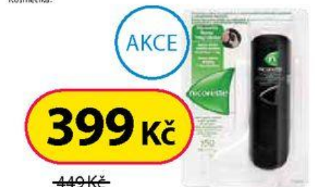
Nicorette® Spray 1 mg / dávka, orální sprej, roztok 13,2 ml