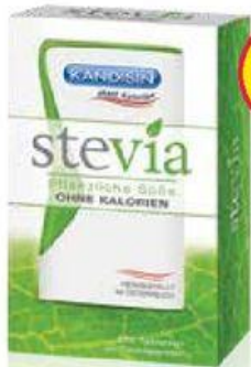
Kandisin Stevia 200 tbl.

Registrovaný léčivý přípravek k vnitřnímu užití. Pečlivě čtěte příbalovou informaci.