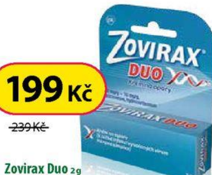
Zovirax Duo 2g