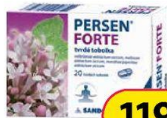
Persen Forte 20 tab.

Lék s účinnou látkou ibuprofen k zevnímu užití. Přípravek je volně prodejný a není hrazen z prostředků zdravotního pojištění. Před použitím si pozorně přečtěte příbalovou informaci.