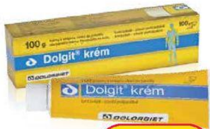
Dolgit krém 100g

Lék k vnějšímu užití. Pečlivě čtěte příbalovou informaci.