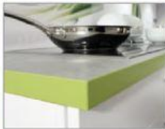
vč. indukční desky