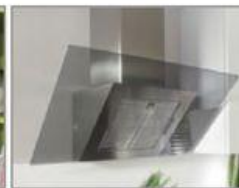
vč. digestoře třídy D 3)