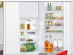
vč. kombinované ledničky třídy A+ 4)

Všechny náklady platí od 05.05. do vyprodání zásob, nejdéle však do 17.05.2015. Tentžďe a tiskové chyby vyhrazeny. Všechny ceny jsou urřeny včetně DPH. Chyby na letáku h, nesprávně a zrušena modely vyhrazeny. Všechny výrobky mohou být vyřazeny pouze v limitovaném množství. Přesné rozměry a náklady za dodání jsou k dispozici u obchodního zřete. Impresum: Vydávatel a nakladatel: XXXLutz obchodní s.r.o. *Cena neměnná za dobu platnosti tohoto oznámení. **Nejsnižovací prodejní cena. Ceny platí při vyvážení zboží na pobřeží. 1-2) Běžná cena na straně 1. 3) Energetická třída spotřebičů. 4) PP bezúplatnou a delší splácení si volíte sami. Zvolte si optimální kombinaci mezi výši přímé platby a počtem pravidelných měsíčních splátek (10 až 48 měsíců). Příklad splátek: cena zboží 10 000 Kč v přímou platbou 0 Kč, výše úvěru 10 000 Kč, počet měsíčních splátek 36, výše měsíční splátky 336 Kč, za úvěr celkem zaplatíte 12 996 Kč, roční úroková sazba 12,96%, RPSN 13,54 %, úvěr bez pojistění schválený spř. úř. Původně jako sponzorovával úvěr pro spř. CETELBA CR, s.r.o. Touto reklamou nevyměká právní nárok na poskytnutí úvěru.