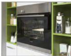
vč. trouby třídy A 3)