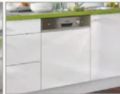
vč. myčky nádobí třídy A 3)