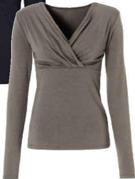
Zavinovací blůza 499,-