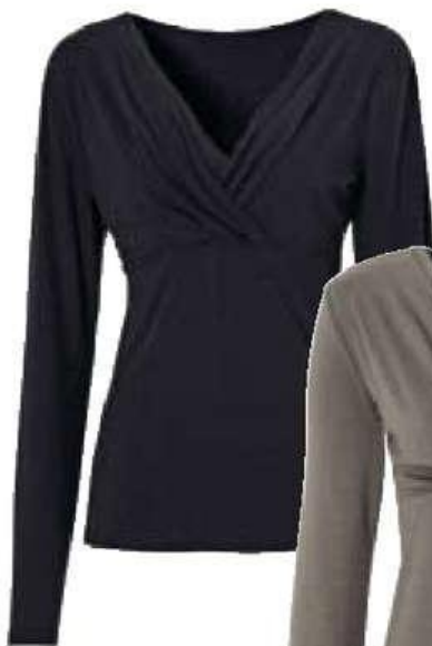
Tričko s dl. rukávem 299,-