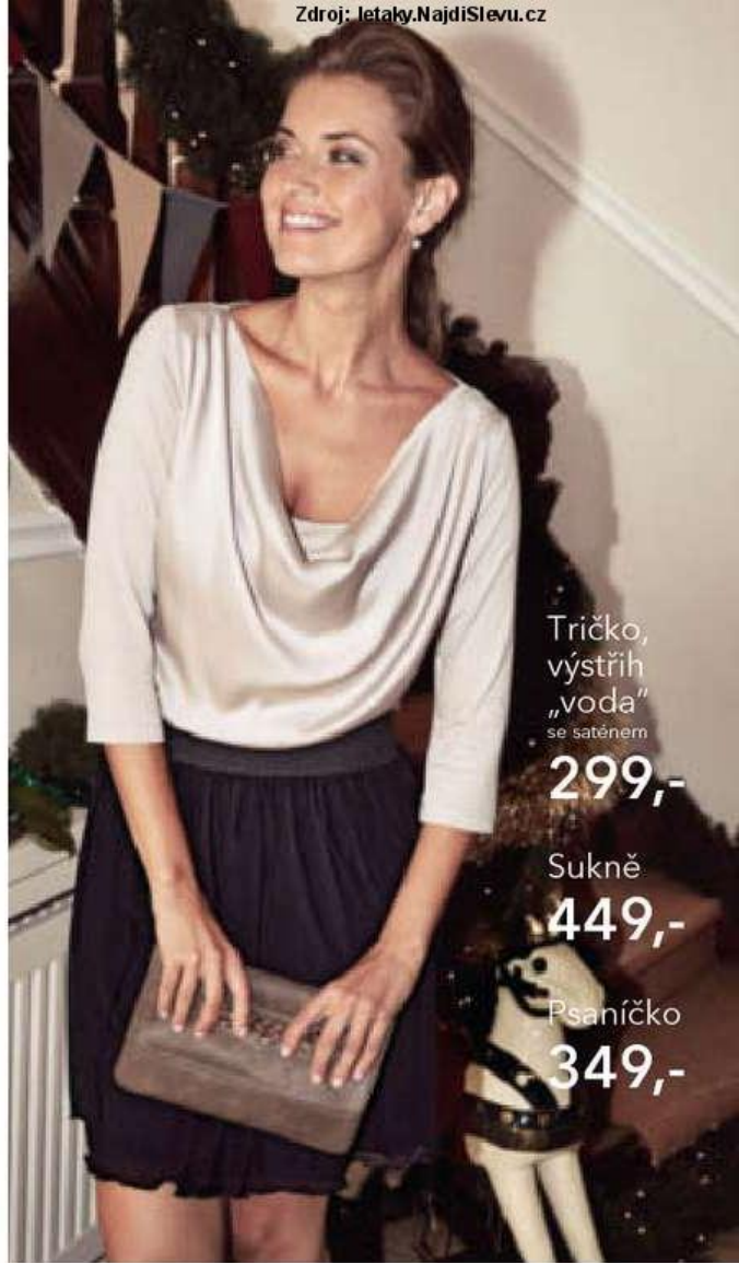
Tričko, výstřih „voda“ se saténem 299,-