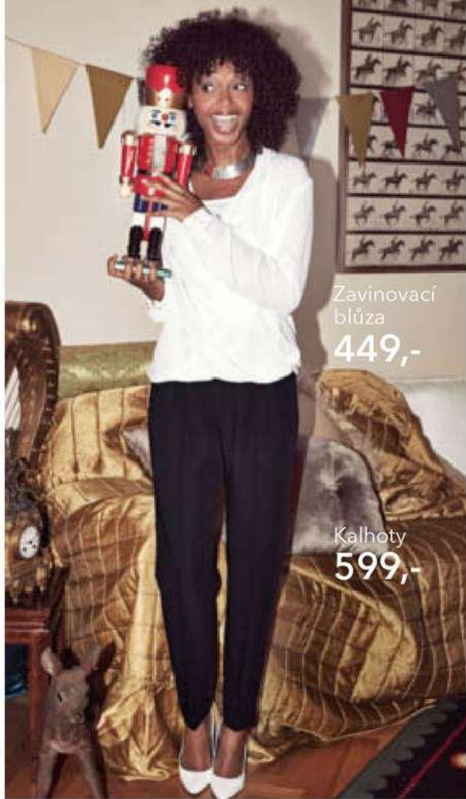
Zavinovací blůza 449,-