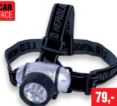
ČELOVÁ SVÍTLILNA 7x LED