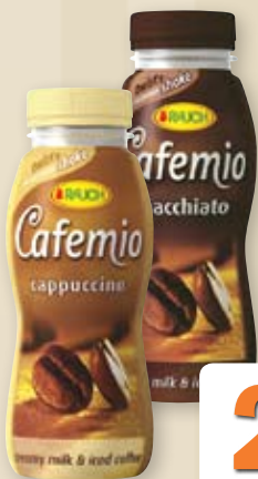
Ledová káva Cafemio 250 ml vybrané druhy; 100 ml = 9,56