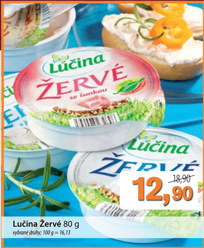
Lučina Žervé 80 g vybrané druhy; 100 g = 16,13