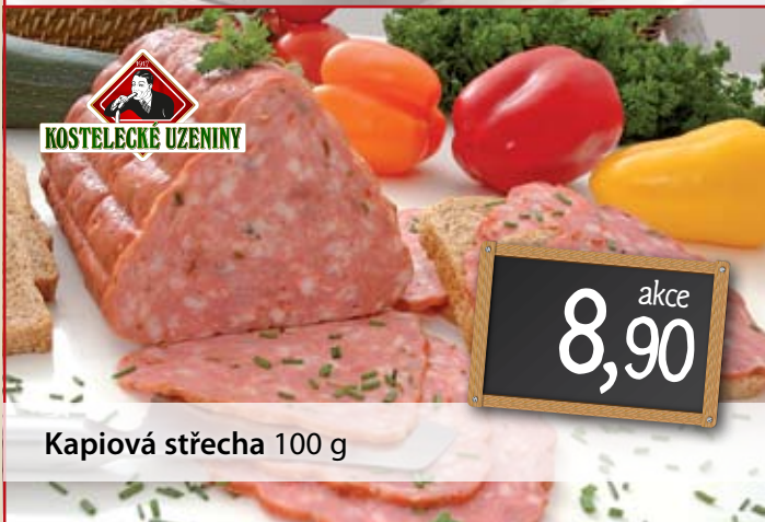
Kapiová střecha 100 g