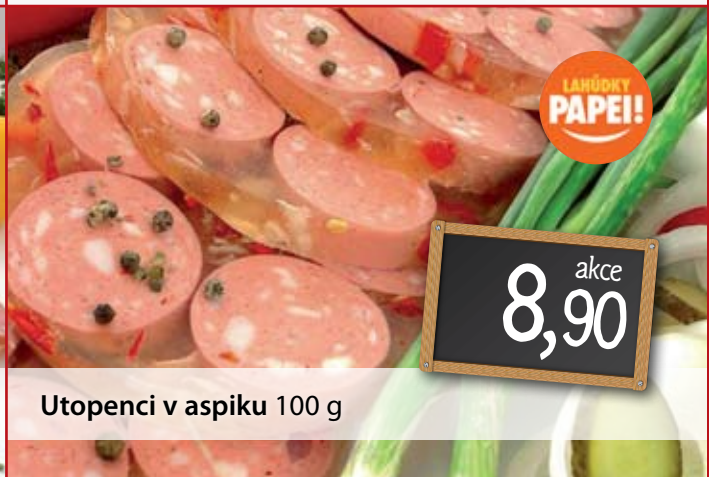
Utopenci v aspiku 100 g