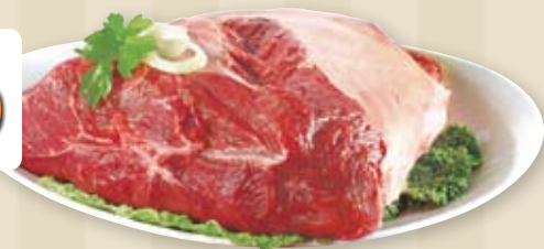
Hovězí plec bez kosti 1 kg