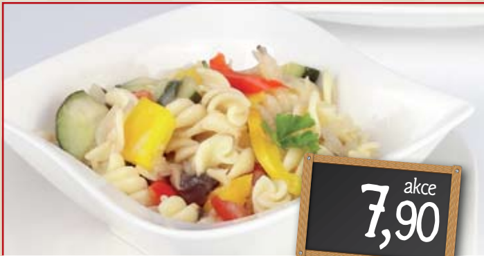
Těstovinový salát 100 g vybrané druhy