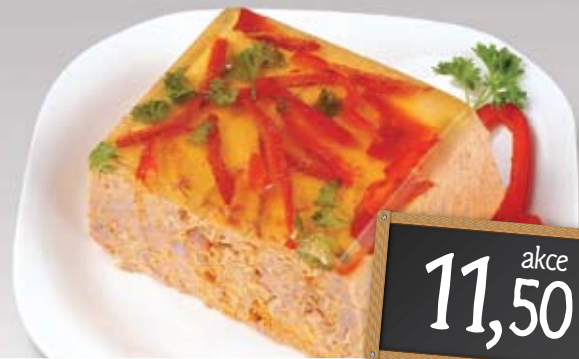
Uherský řez 100 g vybrané druhy