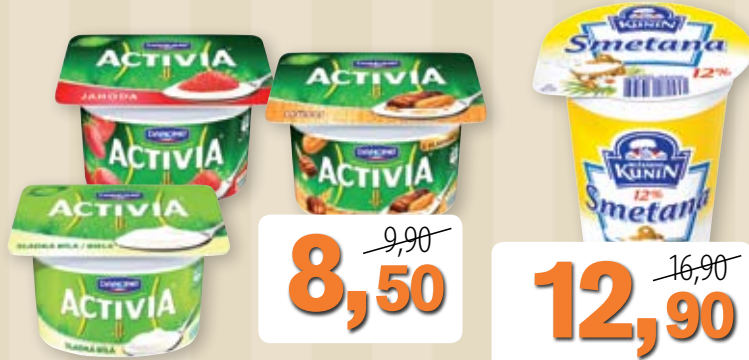
8,50 9,90 Activia 120 g vybrané druhy; 100 g = 7,08