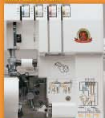
BAREVNĚ ZNAČENÍ DRÁH NITĚ