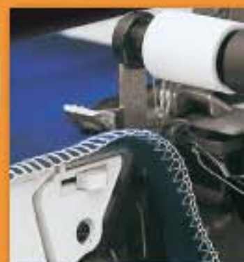
JEDNODUCHÉ NASTAVENÍ ŠÍŘKY LEMU A TLAKU