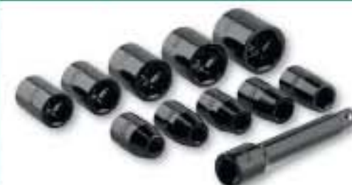
nástrčné nástavce: 9, 10, 11, 13, 14, 17, 19, 22, 24, 27 mm