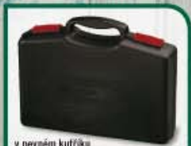
v pevném kufříku