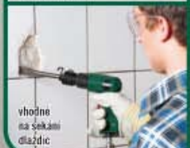
vhodné na sekání dlaždic

PŘÍSLUŠENSTVÍ: ostří sekáč, plochý sekáč, sekáč na řezání rýtl, sekáč na plochu, univerzální sekáč 500ks, 175 mm