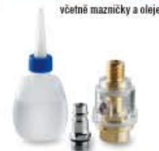
včetně mazničky a oleje