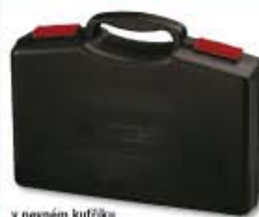
v pevném kufříku