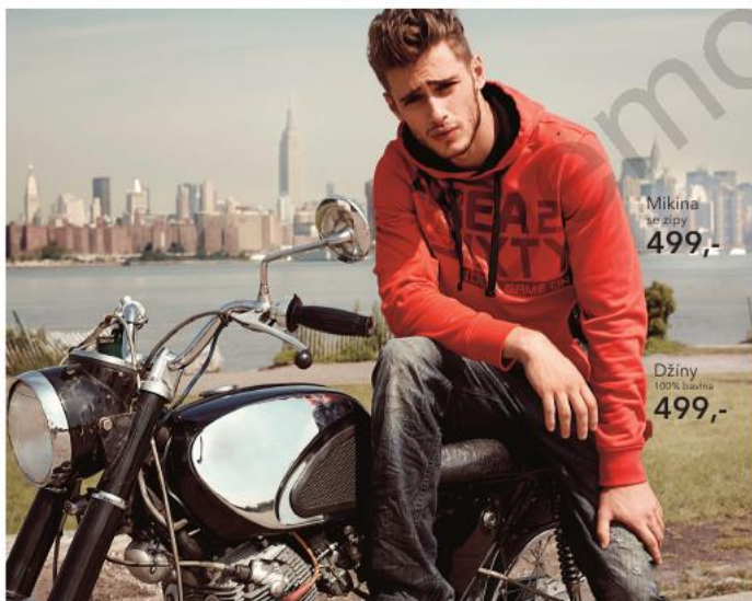
Mikina se zipy 499,-