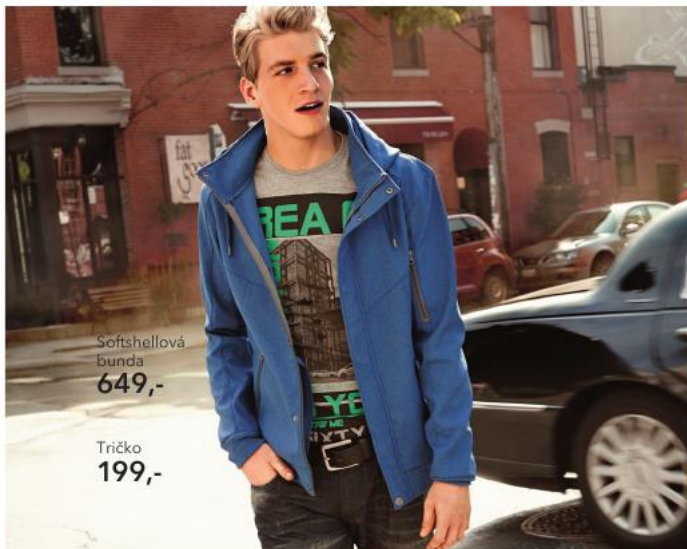
Softshellová bunda 649,-