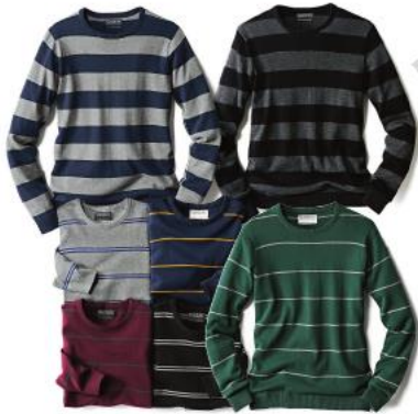
Košile 100% bavlna 249,-