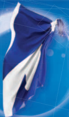
500x PAREO NIVEA