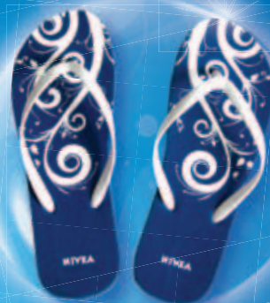
10 000x PLÁŽOVÉ ŽABKY NIVEA