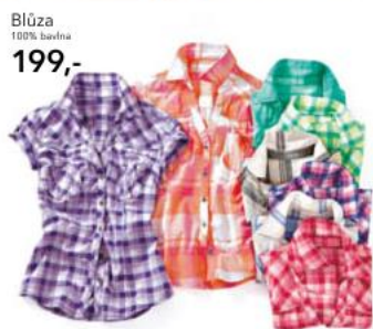
Blůza 100% bavlna 199,-