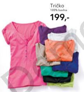
Tričko 100% bavlna 199,-