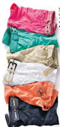
Sukně s páskem 100% bavlna 399,-